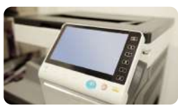
Wifi libre et imprimantes