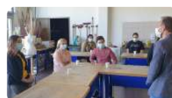
Salles de cours spécialisées BTSA