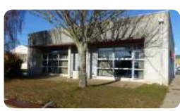
Bâtiment spécialisé BTS

11 semaines de stage en exploitation 4 semaines de stage en organisme 1 semaine de stage collectif