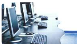
Salles informatiques et multimédia